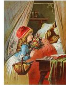
グリム童話「赤ずきん」 ＜ウィキペディア＞

2) 毒親 … 性格が未熟 （ 参照 投影同一化）であるため、 子どもの人格を認めることはせず、子どもを必要以上に支配し管理 （過保護、過干渉）し、 親の理想や考えを子どもに